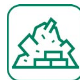
GRAVATS / INERTES