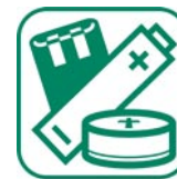
PILES ET ACCUMULATEURS