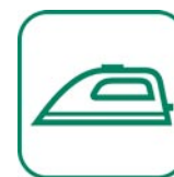
PETITS APPAREILS MÉNAGERS