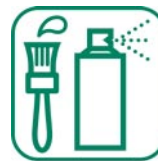
DÉCHETS DANGEREUX DES MÉNAGES